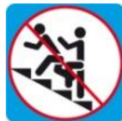
Обгон на лестнице