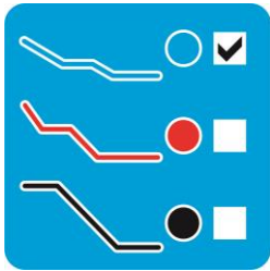
Степень сложности спуска