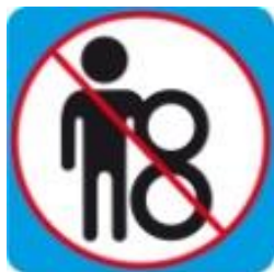
Спуск на двойном круге