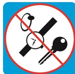
Скатывание с посторонними предметами