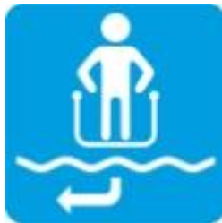
Направление выхода из зоны погружения