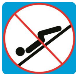
Положение на спине головой вперед