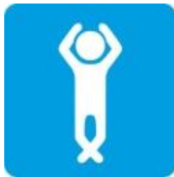
Положение на спине головой назад, ноги скрещены руки за головой