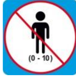
Ограничения по возрасту