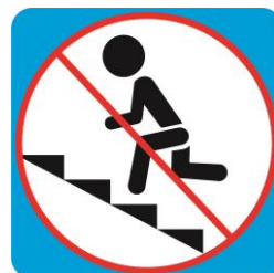
Бег на лестнице