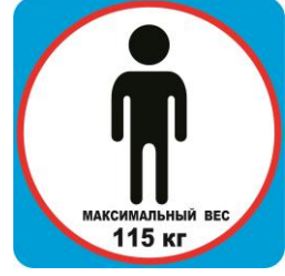
Максимальный допустимый вес